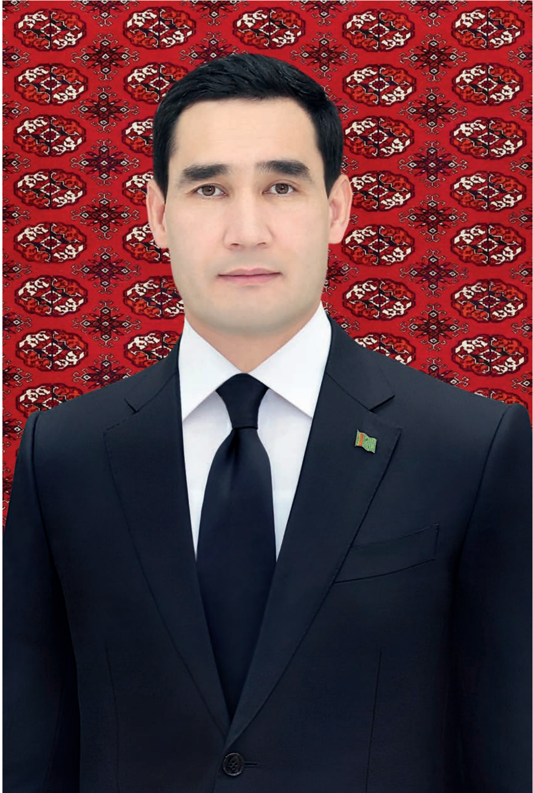
TÜRKMENISTANYŇ PREZIDENTI SERDAR BERDIMUHAMEDOW